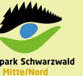
Bio-Musterregion Mittelbaden+ ● Ortenaukreis, Landkreis Rastatt, Stadtkreis Baden-Baden ● 74 Städte und Gemeinden ● 720.000 Einwohner ● 2.740 km 2